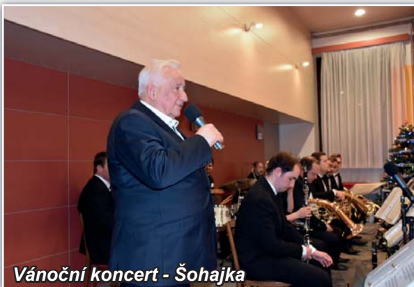
Vánoční koncert - Šohajka