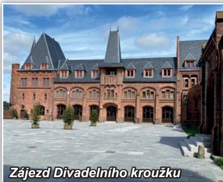
Zájezd Divadelního kroužku