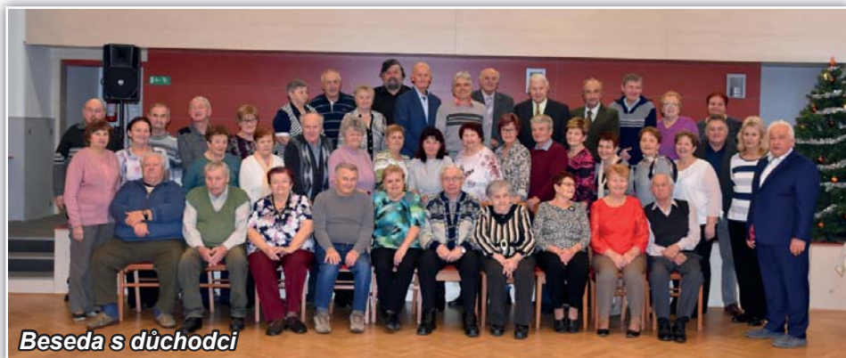
Beseda s důchodci