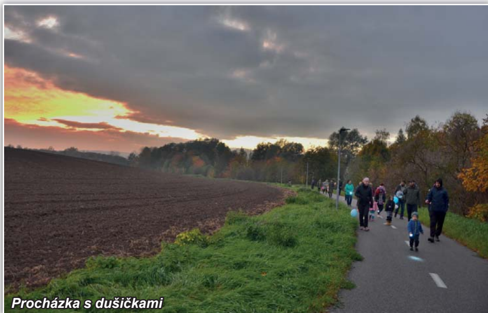
Procházka s dušičkami