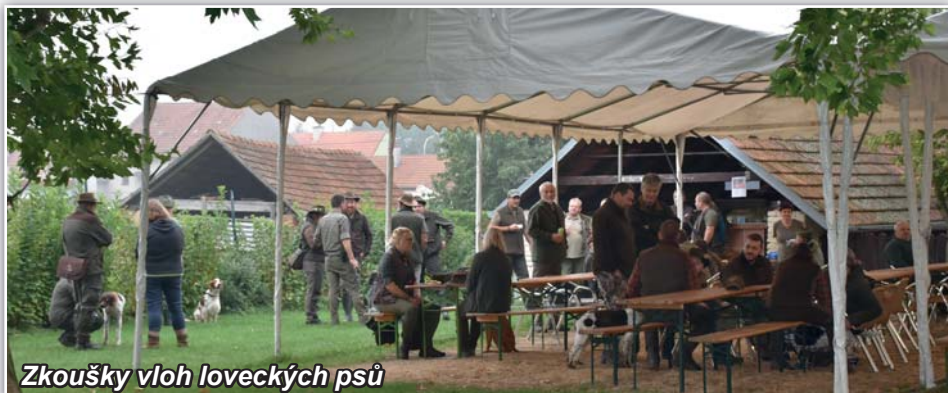
Zkoušky vloh loveckých psů