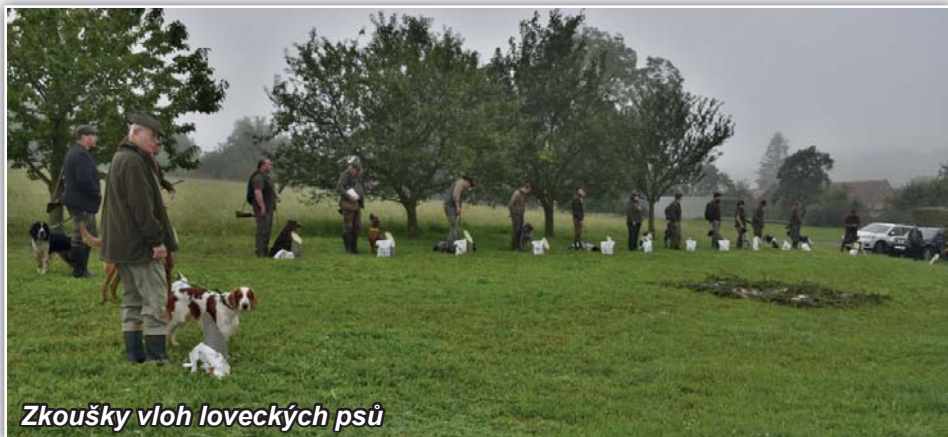
Zkoušky vloh loveckých psů