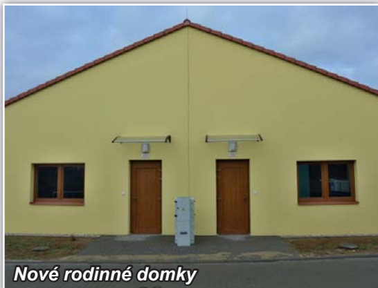
Nové rodinné domky