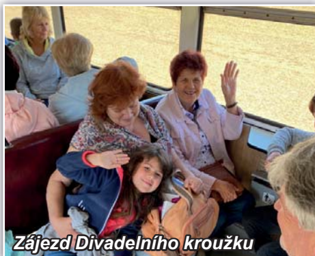
Zájezd Divadelního kroužku