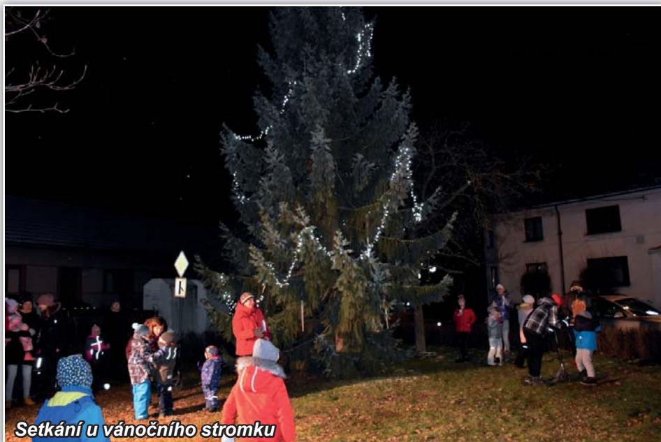
Setkání u vánočního stromku

Silnice přes obec je opravena, z toho důvodu si myslím si, že doba „hájení“ v tomto směru skončila a bude nutné konat, abychom se chovali tak, jak je třeba, nikoho neomezovali v jeho právu chodit bezpečně po chodníku. Je nezbytné si uvědomit, že tam, „kde začíná svoboda prvních, končí svoboda druhých“. Toto ale v naší obci určitě nechceme, abychom ustupovali někomu, kdo je pohodlný a nehodlá respektovat příslušné normy nastavené ve společnosti.