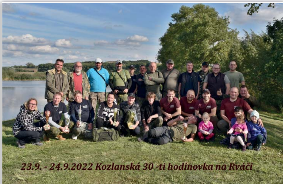
23.9. - 24.9.2022 Kozlanská 30 -ti hodinovka na Rváci