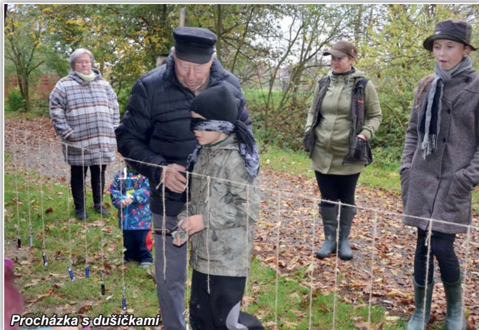
Procházka s dušičkami