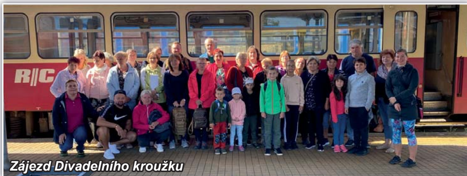
Zájezd Divadelního kroužku