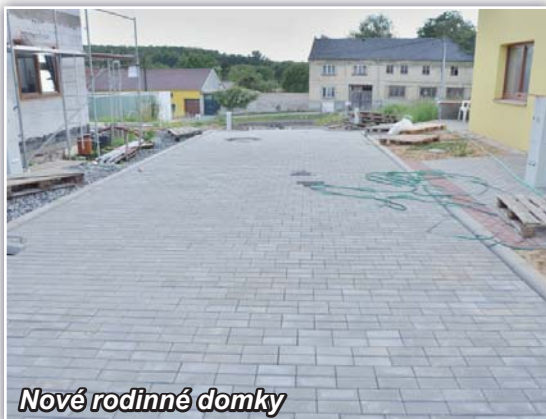
Nové rodinné domky

Chci Vás informovat o všech podstatných věcech, které se v uplynulých čtyřech měsících, od vydání posledního čísla zpravodaje, udály a samozřejmě upozornit i na úkoly, které stojí před námi.