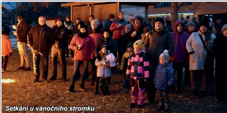
Setkání u vánočního stromku

Toto jsou věci, které si umíme sami ovlivnit a „nasměrovat je, kam potřebujeme“. Nechci malovat čerta na zeď, ale větší problém vidím v opravené silnici, která bude v obci lákat k rychlé jízdě řidiče vozidel, což může ohrožovat chodce i ostatní účastníky silničního provozu. V minulých letech jsem měl zájem o řešení tohoto problému pomocí tak zvaných zpomalovacích semaforů, které můžete stále vidět na silnicích v obcích zejména v kraji Vysočina, ale také v Pardubickém nebo Královehradeckém kraji. Tyto semaforey jsou v Jihomoravském kraji „neprůchozí“, nikdo nám je totiž nepovolí. Divím se, žijeme v jedné České republice, kdy zřejmě funguje regionální výklad práva, poněvadž někde obce k tomuto dopravnímu zařízení souhlas dostali, ale v Jihomoravském kraji to nejde. Pokud jsem se dotěrně