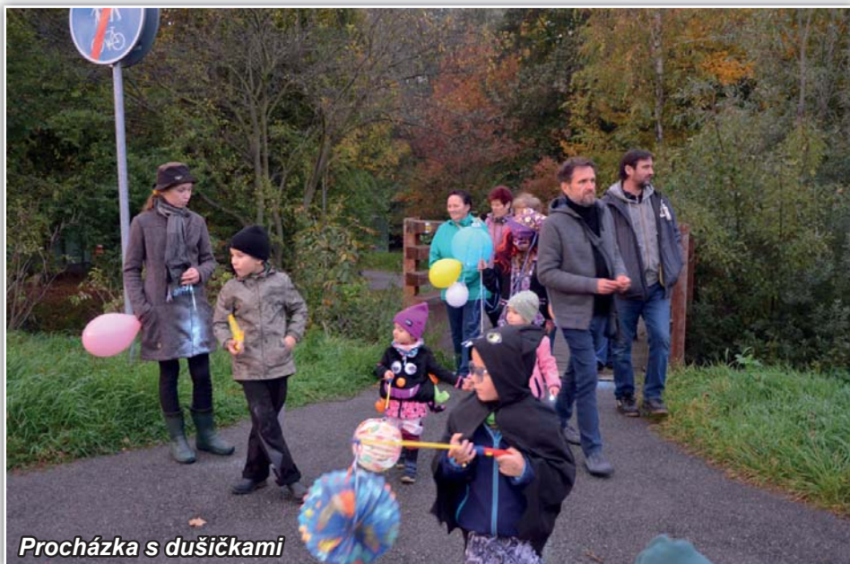
Procházka s dušičkami