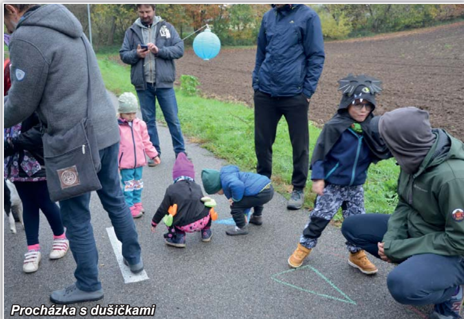
Procházka s dušičkami