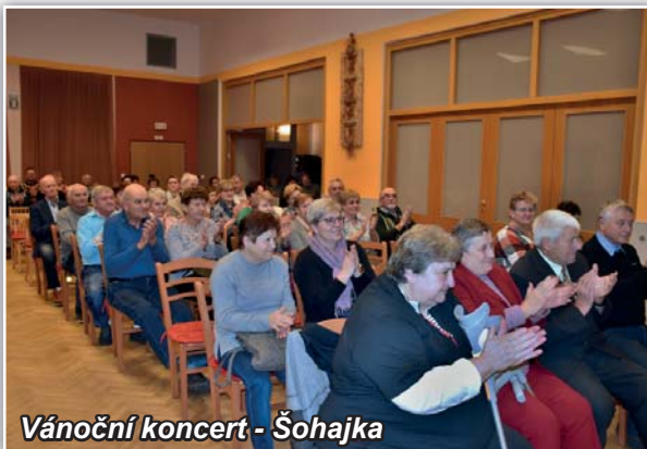
Vánoční koncert - Šohajka