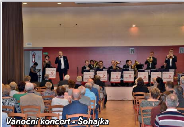
Vánoční koncert - Šohajka

Zmiňoval jsem se o dotacích na budování rodinných dvojdomek pro sociální bydlení, zmíním částky, které naše obec z dotací