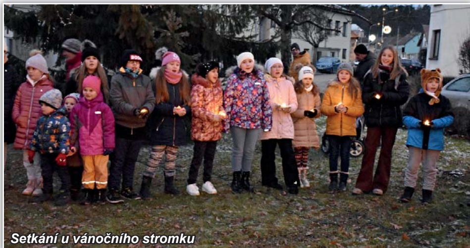
Setkání u vánočního stromku

Rekonstrukce silnice v naší obci trvala téměř 6 měsíců, a to do 1.12.2022, kdy došlo k oficiálnímu zprůjezdnění celého úseku. Zhotovitel stavby postupně ještě upravuje okolí rekonstruované silnice, některé práce – např. odvoz vytěžené hlíny z potoka Runza bude možno provést až v jarních měsících, a to s ohledem na zhoršující se počasí v těchto dnech. Přes naši obec zatím projíždějí většinou jen