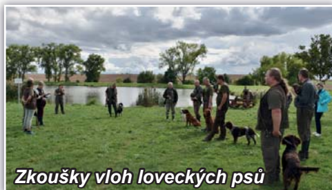
Zkoušky vloh loveckých psů