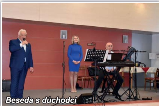
Beseda s důchodci

Pevně si stojím za svým názorem, že se nenechám nikým někam tlačit nebo manipulovat, není