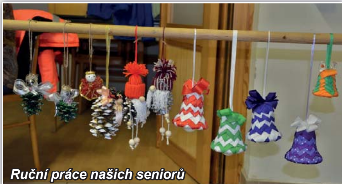
Ruční práce našich seniorů