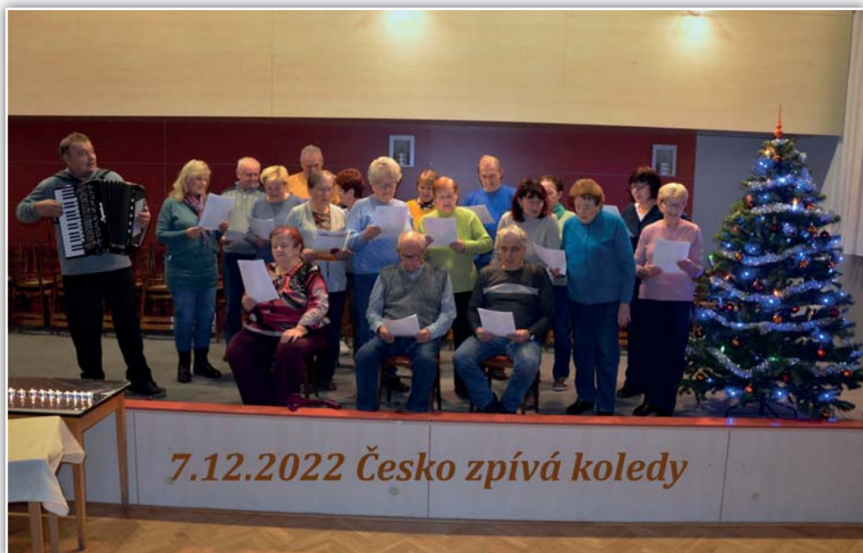
7.12.2022 Česko zpívá koledy