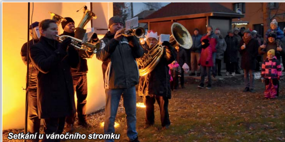
Setkání u vánočního stromku

V době provádění rekonstrukce silnice v obci byla tolerována řada věcí a měli jsme pochopení i pro občasná nestandardní parkování vozidel našich občanů. Silnice č. II/429 je již zpět v řádném provozu, každý z občanů se dostane ke svému domu nebo i vjezdem do svého domu, a proto není možné již tolerovat parkování vozidel jednou polovinou na chodnících nebo i na vjezdu do domu kolmo přes chodník. Tato vozidla omezují nejen průchodnost chodníků pro chodce, ale maminky s kočárky musí vstupovat z chodníku do vozovky, aby obešly vozidlo zaparkované v rozporu s platnou legislativou. Problém také nastává při zimní údržbě chodníků, kdy naše technika není schopna po chodníku projet, poněvadž nesprávně zaparkované