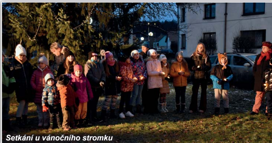
Setkání u vánočního stromku