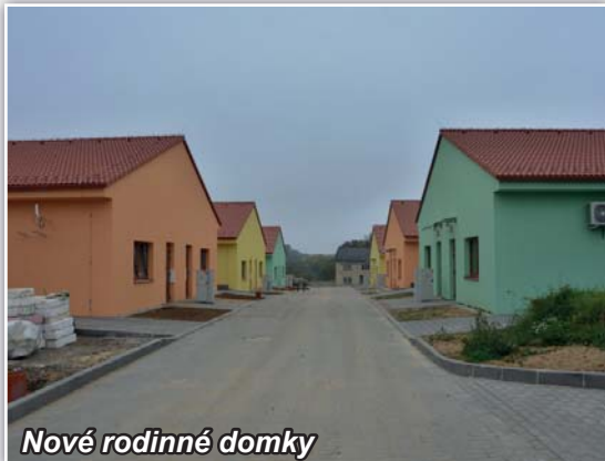
Nové rodinné domky