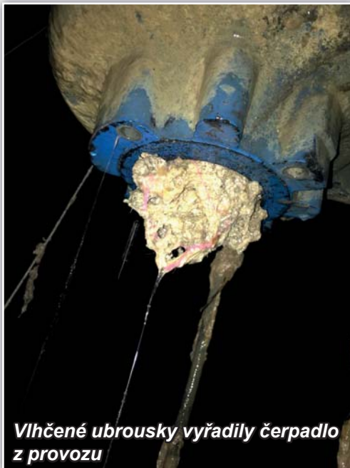
Vlhčené ubrousky vyřadily čerpadlo z provozu

Pokud je mi známo, jednalo se o lípy v bývalé aleji za zahradami od nynějšího obecního mlatu až do Hliníka. Bohužel, dnes zde již devět lip není, jsou zde přestárlé lípy v počtu čtyř stromů.