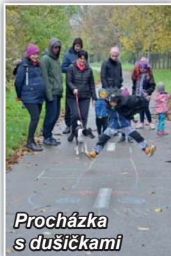
Procházka s dušičkami