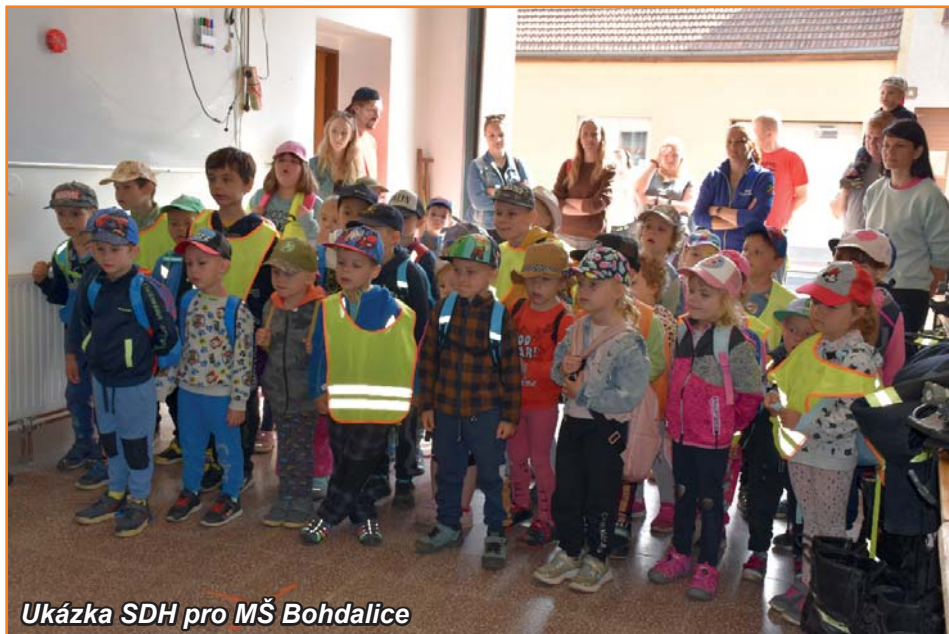
Ukázka SDH pro MŠ Bohdalice