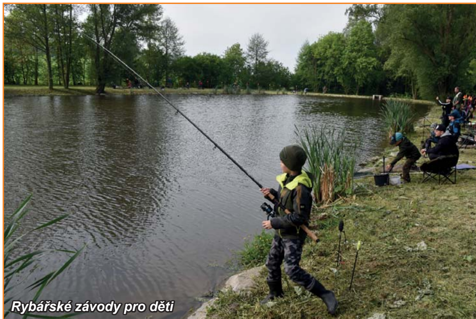
Rybářské závody pro děti