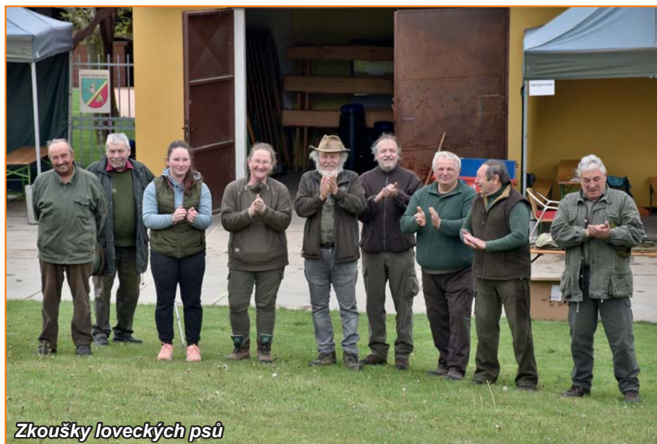
Zkoušky loveckých psů