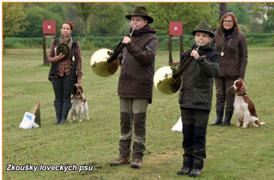
Zkoušky loveckých psů