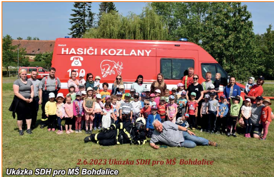
2.6.2023 Ukázka SDH pro MŠ Bohdalice