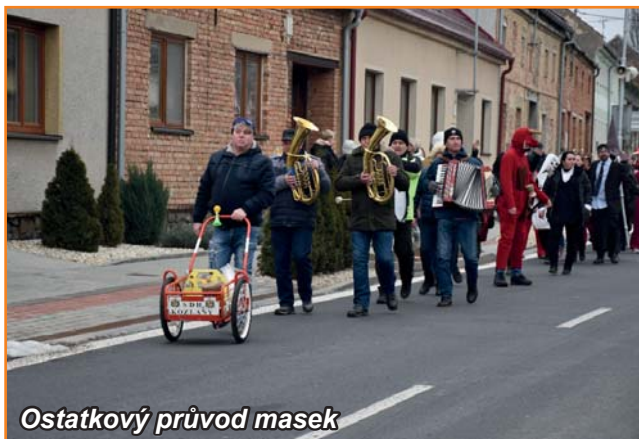
Ostatkový průvod masek

Sbor dobrovolných hasičů zahájil rok 2023 Výroční členskou schůzí konanou v pátek 6. ledna. Zde jsme se ohlédli za naší činností v roce 2022 a naplánovali rok letošní. Starosta a velitel sboru se 28. ledna účastnili Výroční schůze okrsku Bučovice, kde se zhodnotila činnost jednotlivých sborů, stanovil termín konání Okrskové soutěže a dále proběhlo focení praporů jednotlivých sborů okrsku. Pořízené fotografie se stanou obrazovou přílohou knihy pojednávající o historické hasičské technice a právě praporech. Tato kniha je v současnosti připravována Okresní od-