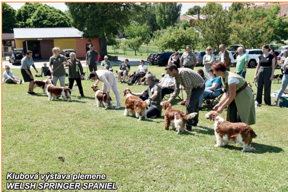
Klubová výstava plemene WELSH SPRINGER SPANIEL