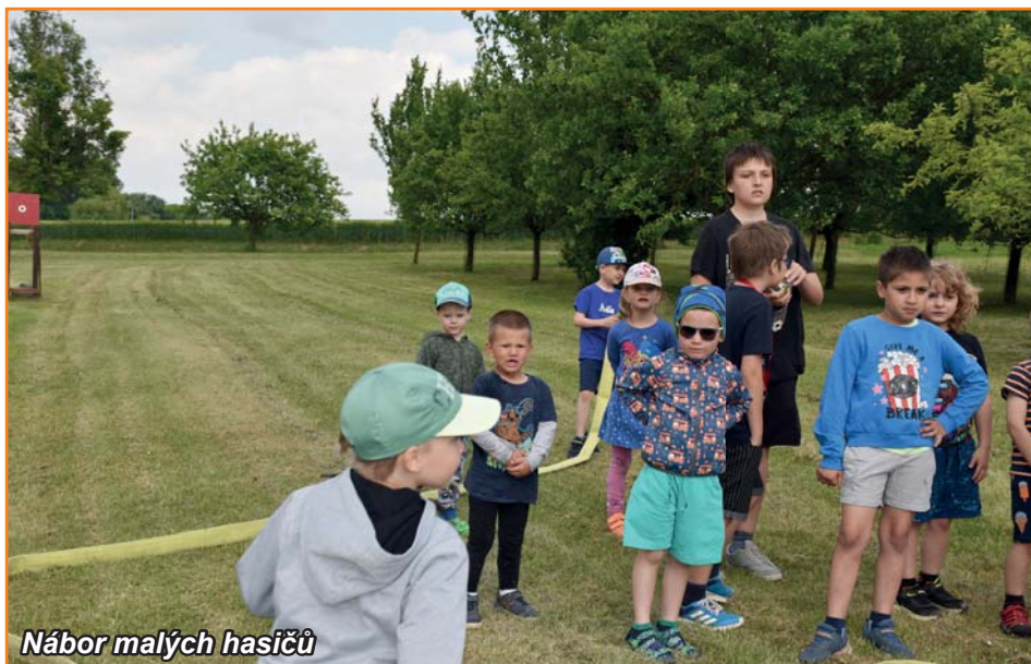
Nábor malých hasičů