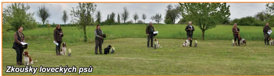
Zkoušky loveckých psů

Měsíc únor a březen byl v MS Kozlany zasvěcen brigádám. Celkem se uskutečnily čtyři brigády. Dvě brigády spočívaly v odstranění pletiva z kultur, které byly zalesněny (obnoveny) v roce 2014 a 2016. V lokalitě Řežavá byl proveden i výchovný zásah (prořezávka) na ploše 0,50 ha.