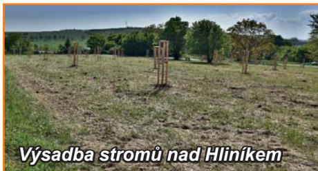
Výsadba stromů nad Hliníkem