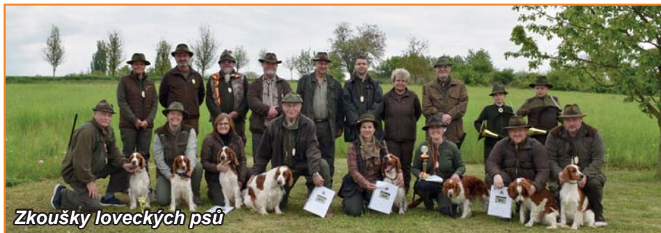
Zkoušky loveckých psů