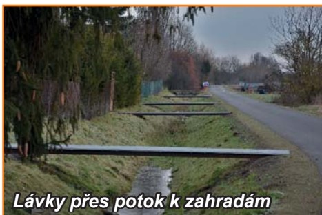
Lávky přes potok k zahradám