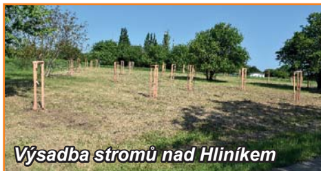
Výsadba stromů nad Hliníkem