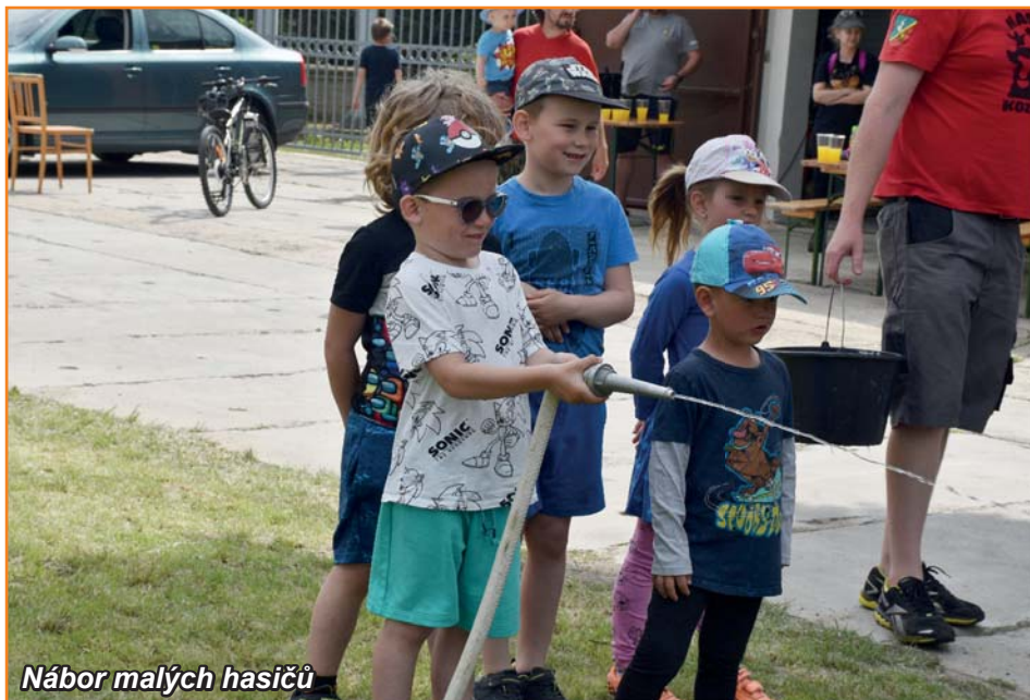
Nábor malých hasičů