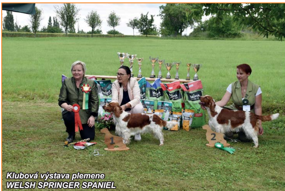
Klubová výstava plemene WELSH SPRINGER SPANIEL