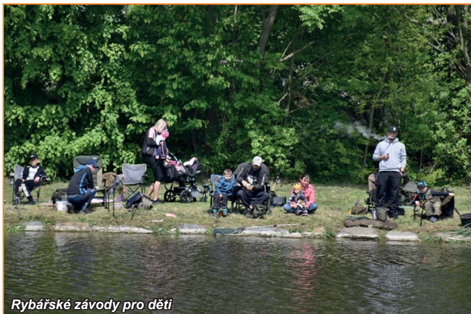
Rybářské závody pro děti