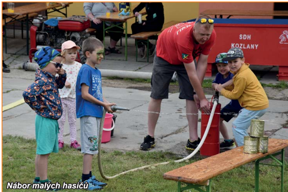
Nábor malých hasičů