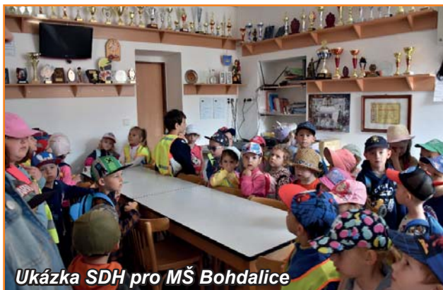
Ukázka SDH pro MŠ Bohdalice