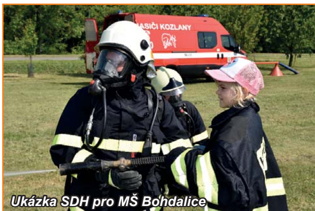
Ukázka SDH pro MŠ Bohdalice