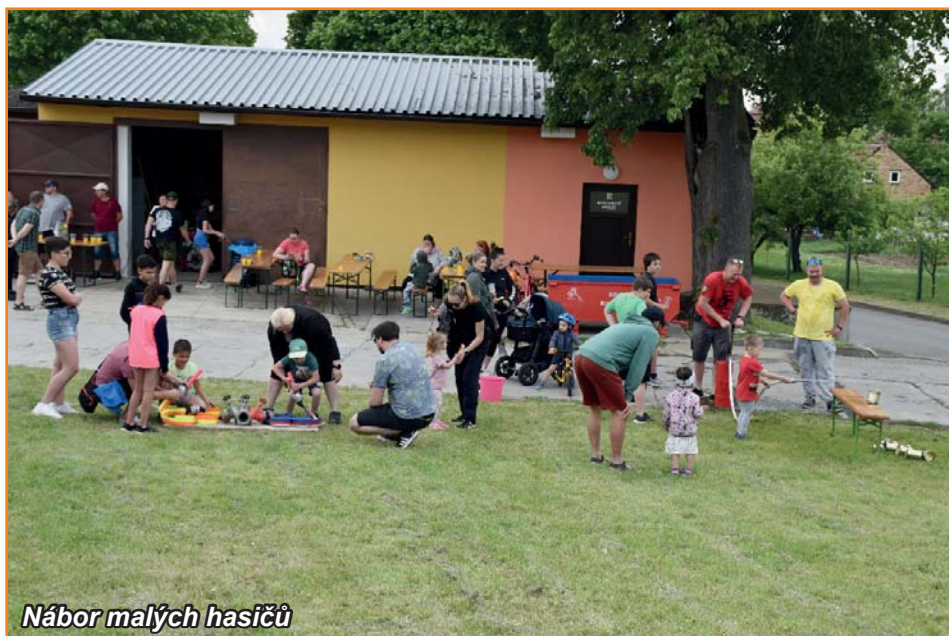
Nábor malých hasičů