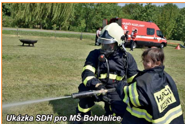
Ukázka SDH pro MŠ Bohdalice

Kojátky-Šardičky – vítěz s časem 38:60 s, Bučovice, Kozlany – B, Ludvíkov pod Smrkem, Staří kozli. Stejná družstva si to mezi sebou rozdala ještě jednou při tzv. rozstřelu o Uzené překvapení pana starosty, kdy svou aktuální formu opět potvrdili borci z Kojátek-Šardiček. Gratulujeme. Zde je však na místě zmínit, že družstvo Kojátek nedorazilo v kompletním složení 7 závodníků a na chybějících postech (mašina, spoj a koš) byli doplněni domácími borci z Kozlan. Tato výpomoc byla nakonec oceněna lahvinkou dobrého domácího moku a kusem uzeného, takže spolupráce, jak má být. Pálení čarodějnic mělo také skvělou účast, o kterou se postarali zejména naši nejmenší čarodějové a čarodějnice. Po herní části a zapálení vatry všichni uhasili svou žízeň a zahnali hlad opečenými špekáčky.