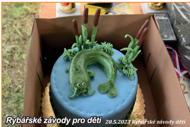
Rybářské závody pro děti 20.5.2023 Rybářské závody děti