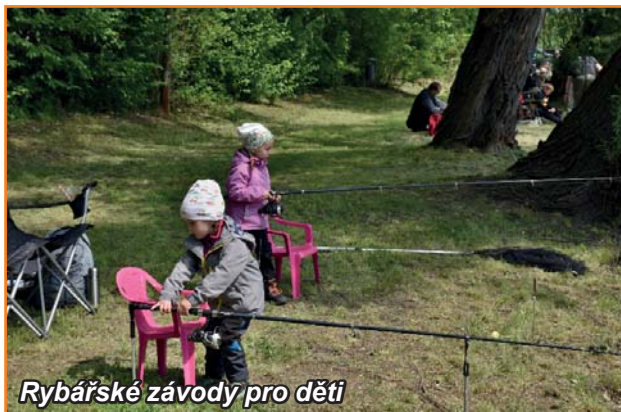
Rybářské závody pro děti

V sobotu 4. března jsme v prostorách obecního sálu uspořádali 23. Rybářský ples, který se, soudě dle počtu příchozích hostů, dlouhodobě těší velké oblibě. Jen sem tam zůstala nějaká volná židle u stolu. Hudební kulisu vytvořila skupina Panorama, která nemalým dílem přispěla k vytvoření báječné atmosféry. Tombola byla opětovně bohatá a nebyly by to ples rybářů, kdyby se nelosovaly i ryby, tentokrát v podobě poukázek.