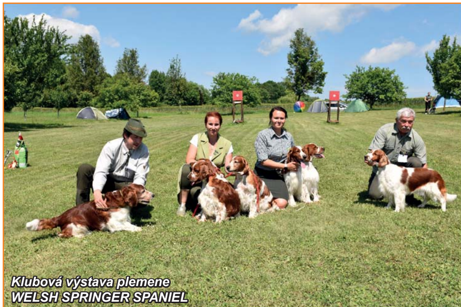
Klubová výstava plemene WELSH SPRINGER SPANIEL