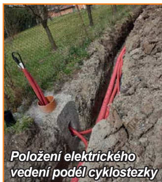
Položení elektrického vedení podél cyklostezky

Jaké však bylo moje překvapení, když v sobotu 24.6.2023 na zahrádce v naší obecní hospodě