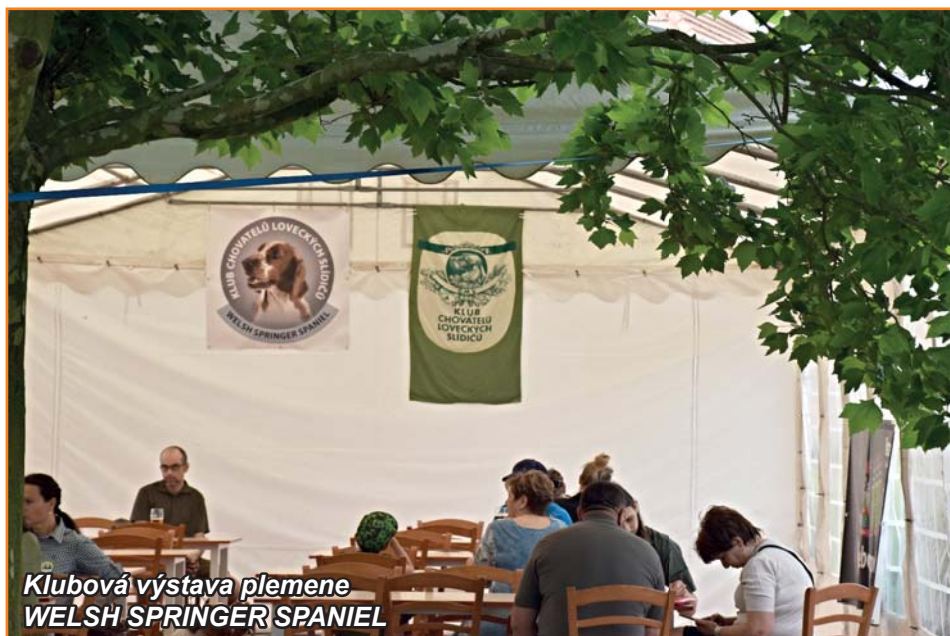
Klubová výstava plemene WELSH SPRINGER SPANIEL