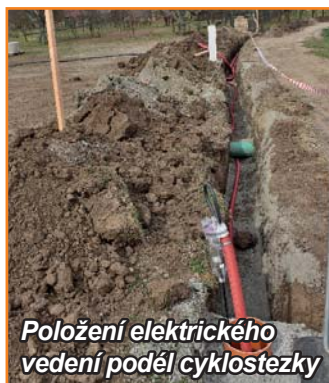
Položení elektrického vedení podél cyklostezky