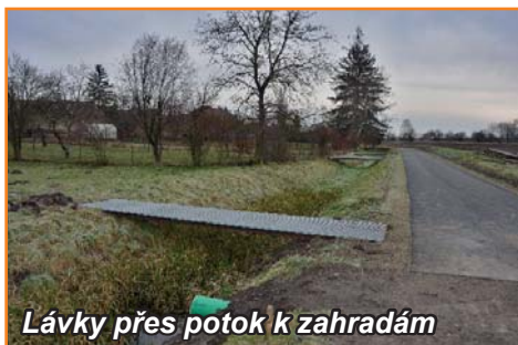
Lávky přes potok k zahradám

Na jaře letošního roku jsme započali s úpravami v obecní zahradě, a to zejména s úpravou plochy, kde bývají postaveny dva velké pártý stany. Po zkušenosti z minulých let jsme viděli, že travnatá plocha pod stany se „nedá uzalévat“ a tráva se postupně změnila na prašný a nerovný povrch. Také je nám jasné, že životnost obou pártý stanů není neomezená a že do budoucna bude nezbytné řešit nově zakrytí prostoru pro diváky či hosty akcí v obecní zahradě. Nakonec padlo rozhodnutí v následujících letech vybudovat v zahradě zastřešenou pergolu, která bude odpovídat ploše současných stanů, což je