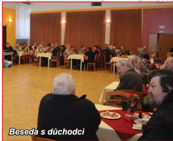
Beseda s důchodci

Vážení občané, upřímně Vám všem za dosavadní práci i spolupráci ve prospěch rozvoje naší krásné obce jménem svým i jménem celého zastupitelstva děkuji.