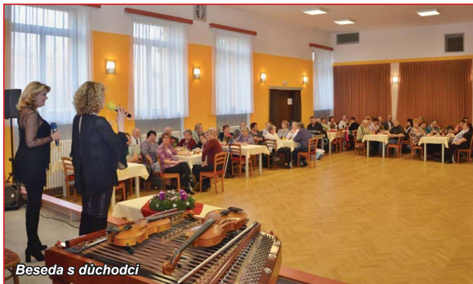
Beseda s důchodci