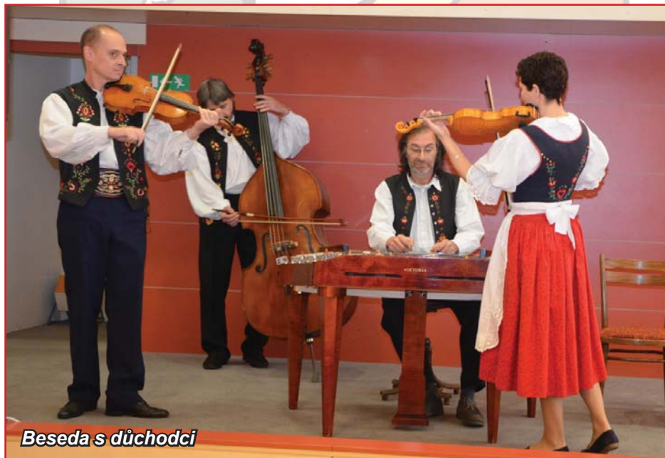
Beseda s důchodci