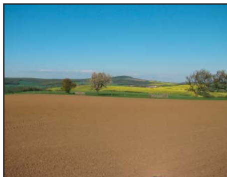
Provádějí výsadbu interakčních prvků kolem polních cest