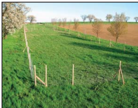
Provedena výsadba zeleného pásu Tvareštotin