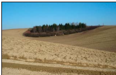
Myslivci ve spolupráci s obcí pečují o dřívě založené remízy