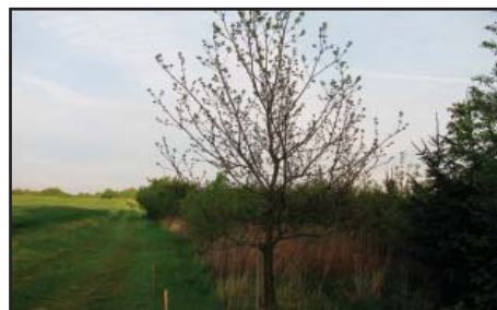
... výsadba kaštanovníku setého (během 10-ti let růstu již 2x poškozen zemědělskou technikou)