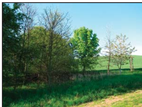
... výsadba jírovců