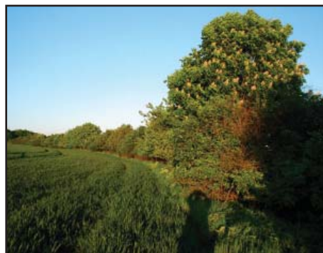
Provádějí výsadbu ovocných stromů, jírovců, jeřábů, kaštanovníku setého