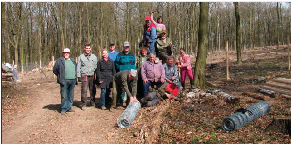
Provedena výpomoc obci při obnově lesa Řežavá